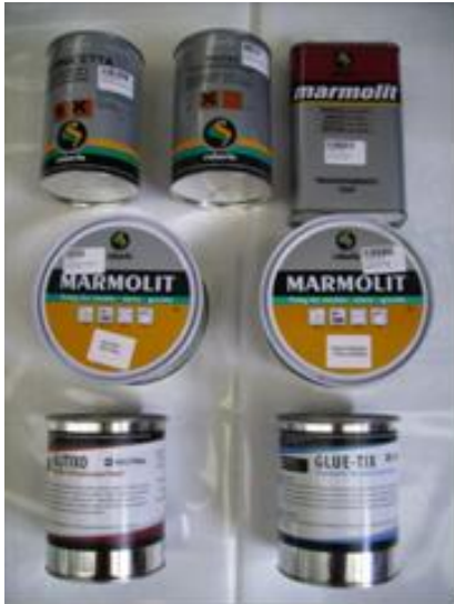
Pegamento líquido/pasta y abrillantadores para mármol y granito.